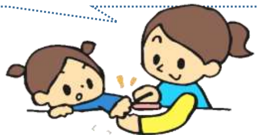
つめはみじかくさじましょう

少し爪が伸びている子ども達が見受けられます。お友達との関係づくりも少しずつ出来て、お友達とのふいのトラブルや、自分で自分をひっかいてしまったりして、怪我や嫌な思いをする事にもつながりますので、お家で爪が伸びてきたら切ってあげましょう。また保育園で気付きましたら、お声掛けさせていただきます。